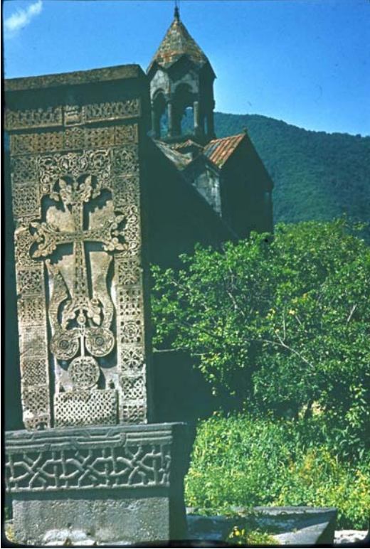
Հաղպատի վանքի խաչքար

2002 թ. Լոռու մարզի արդյունաբերական արտադրանքի ընդհանուր ծավալում Գուգարքի տարածաշրջանի տեսակարար կշիռը կազմել է 3 %,մանրածախ ապրանքաշրջանառության մեջ՝ 3 % և ծառայությունների ընդհանուր ծավալում՝ 5.7 %: