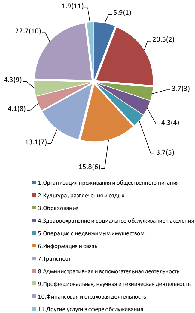
Структура услуг за январь-апрель 2018г.