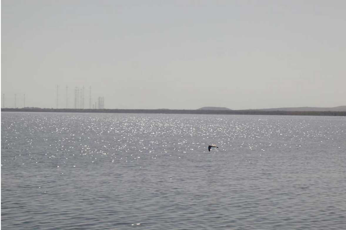
εἰς τὸν ἑσπέρου ἕως τῆς ἑσπέρου ἄ