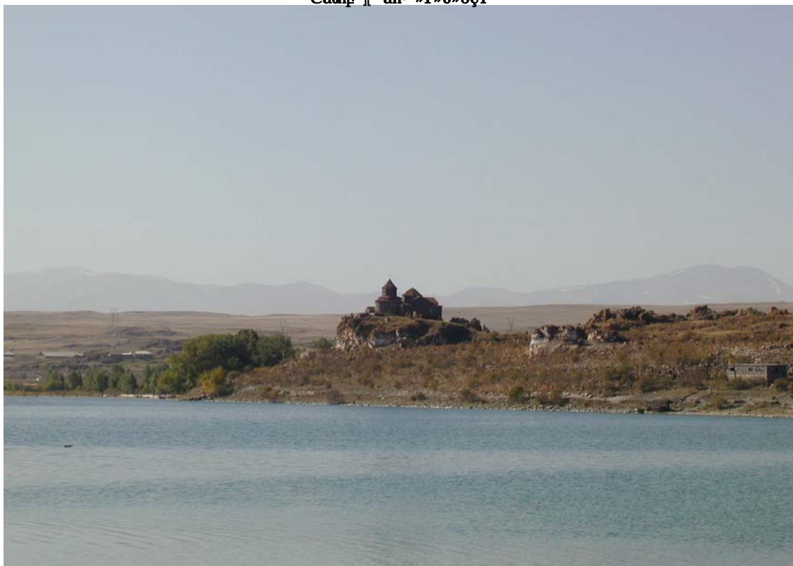
Եանր Է՞ ան »Ի»Օ»ճԿ