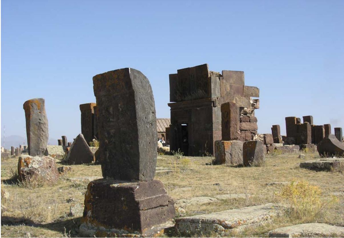
≈ Ὑόῦῃ ἰϕ ἱαῖε ἰῖῃ Ὑῃῃῃ