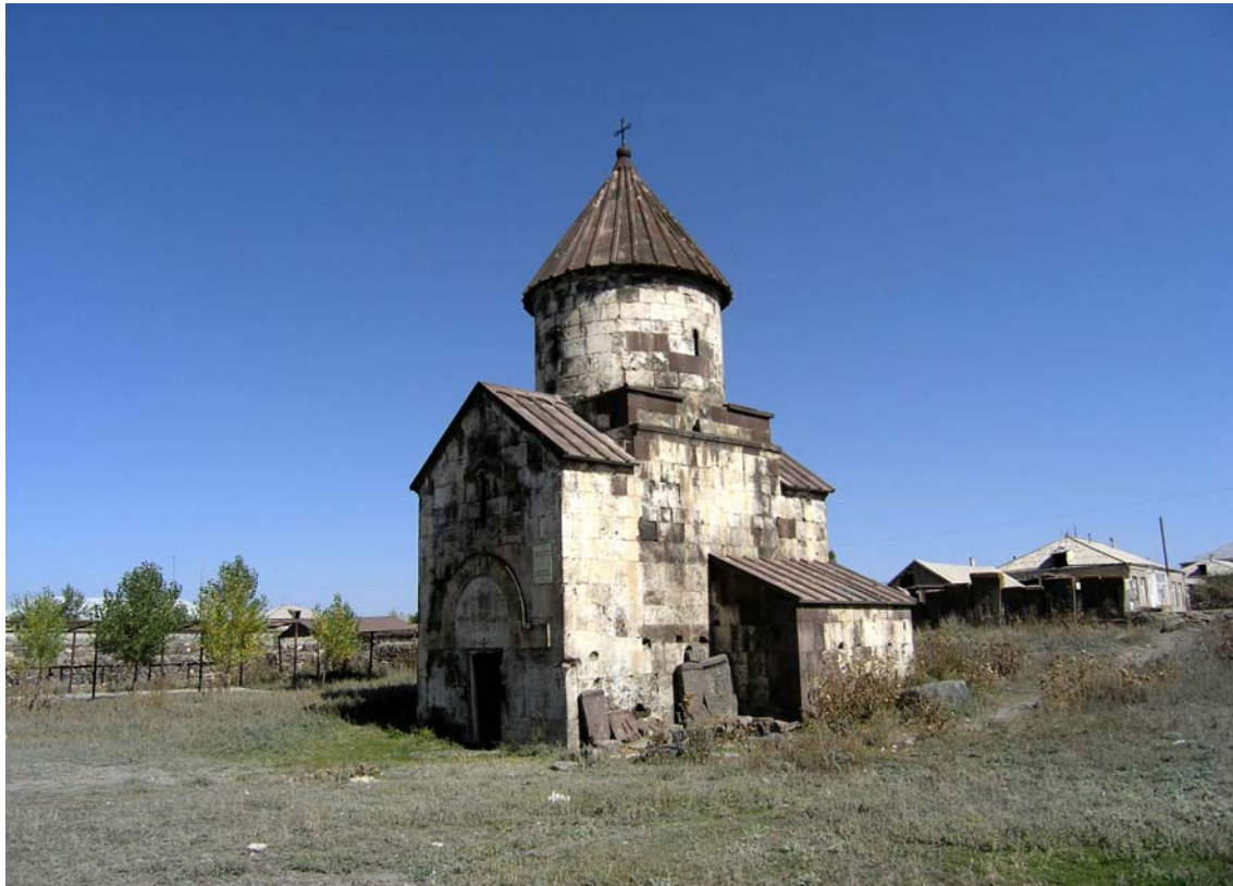
Եանր Մ ան. »Ի»Օ»ճԿ