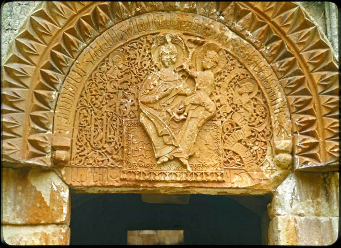
ԾՅ Ի ԻՅ Ի Սանճ ԻՅ ԿՈՇ