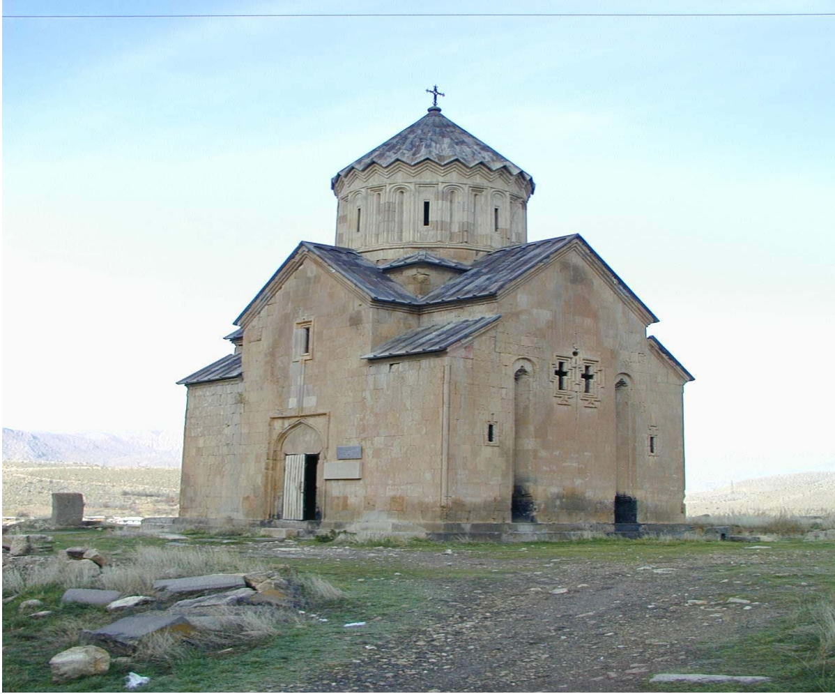
ԳՆԻՍՏՆԻՍԻՆԻՍ ԵՐԿՐԱՆՆԵՐԻ ՄԱՐԿԱՆԵՐԸ