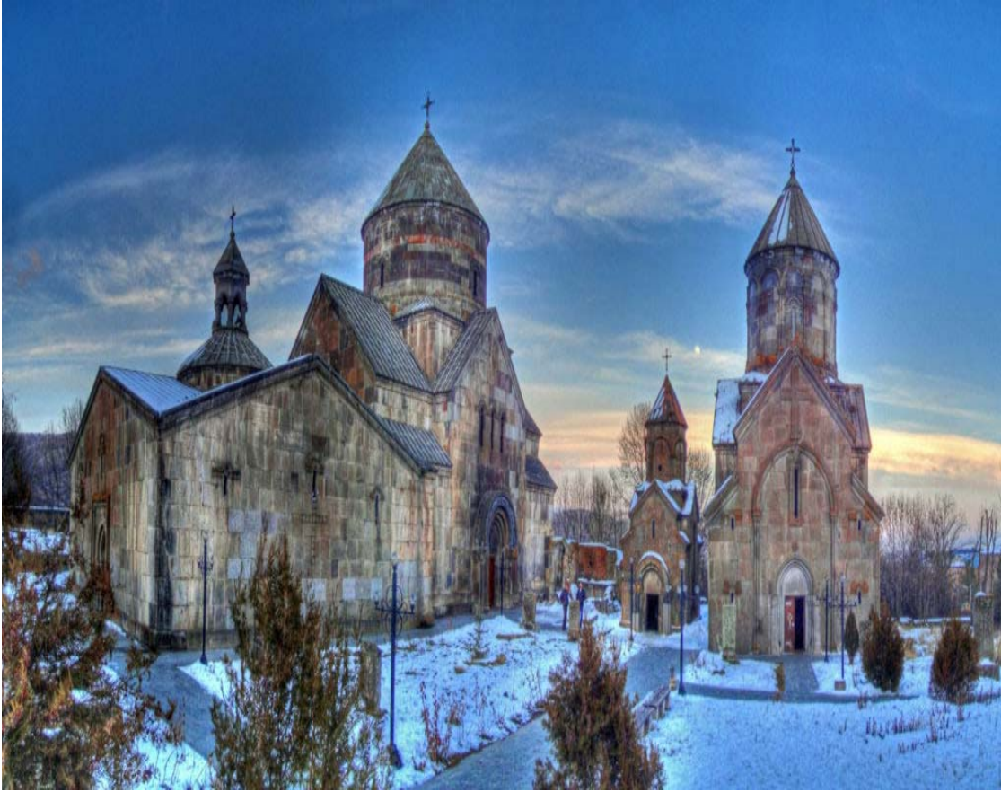
Կեչառիս վանքային համալիրը Շաղկաձորում