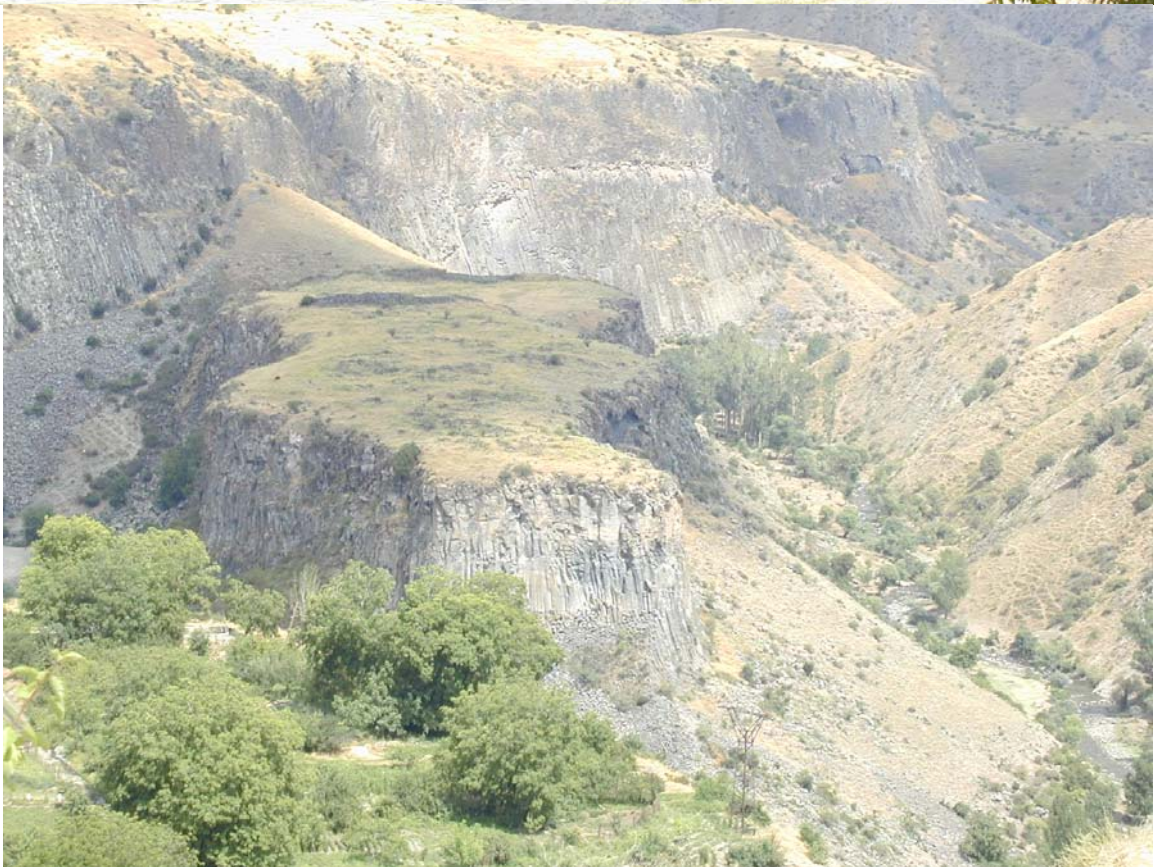
Գեղեցիկ տեսարան Գառնու տաճարից