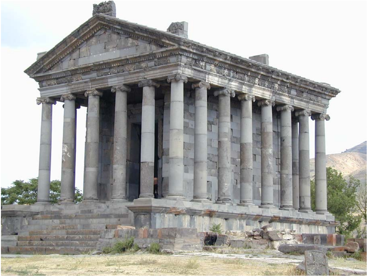
Գառնու հեթանոսական վեհապետի տաճարը